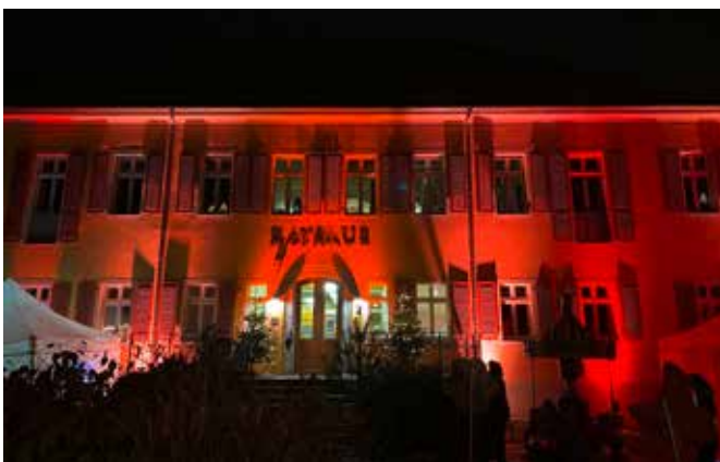
Weihnachtsmarktpremiere am Rathaus