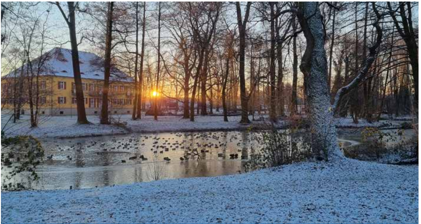
Winter in Bernsdorf

Amts- & Mitteilungsblatt der Stadt Bernsdorf mit den Ortsteilen Großgrabe, Straßgräbchen, Wiednitz, Zeißholz 05.02.2022