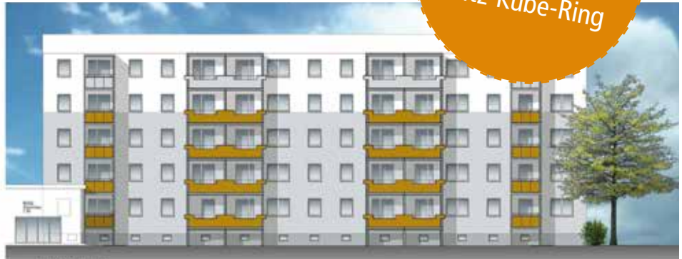
Ansicht von Westen - 1 BA