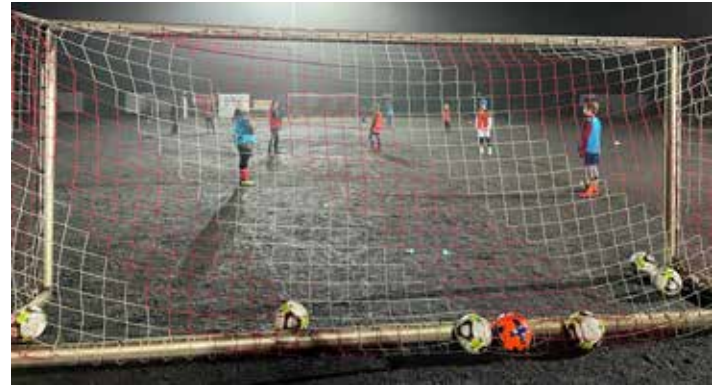
Letzter Trainingstag vor Weihnachten

Die zu Beginn des Jahres 2021 verfügte Sperrung der Sportanlagen veranlasste leider einige Sportfreunde auf neue Hobbys auszuweichen. Andere wurden ab Mitte des Jahres motiviert, sich dem Fußballsport zuzuwenden. So konnte die Spieleranzahl konstant gehalten werden. Nach