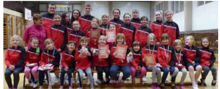
Mit neuer Trainingsbekleidung starten die Gerätturner des SV Straßgräbchen in das Jahr 2022

Und die Überraschungen? Mit Hilfe seiner Sponsoren, Unterstützer, Spender und sonstigen Helfern konnte der Vorstand des SV Straßgräbchen tief in die Tasche greifen und neben einem Weihnachtspresent für jedes Mitglied der Sportgruppe eine Trainingsjacke spendieren. Beim