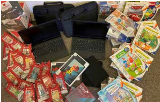
Unsere Bibliothek - zeitgemäß digital Schritt für Schritt