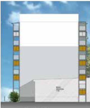
Ansicht von Osten - 1 BA

NEUIGKEITEN zum Bauvorhaben Fritz-Kube-Ring