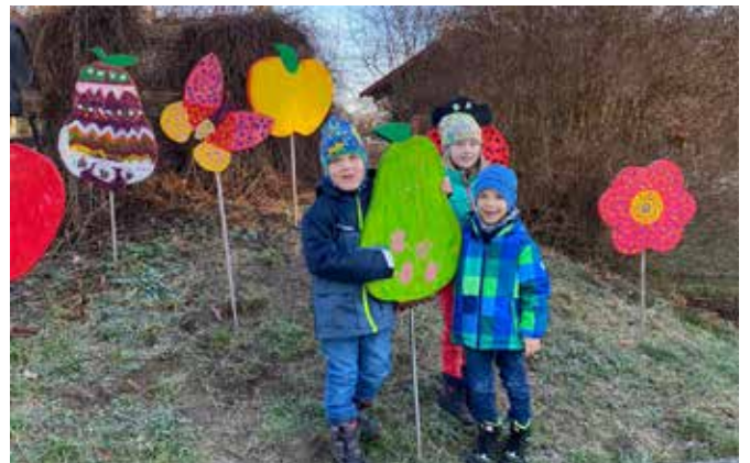
Kinder der CSB Kita „Fuchs & Elster“ gestalten ihren Heimatort bunt