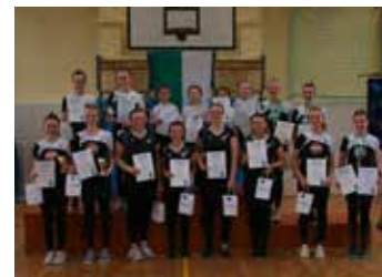
Bild vom Mannschaftswettbewerb am 5.3.2023 in Wiednitz 4er Frauen, Junioren, Schüler 1 und Schüler 2