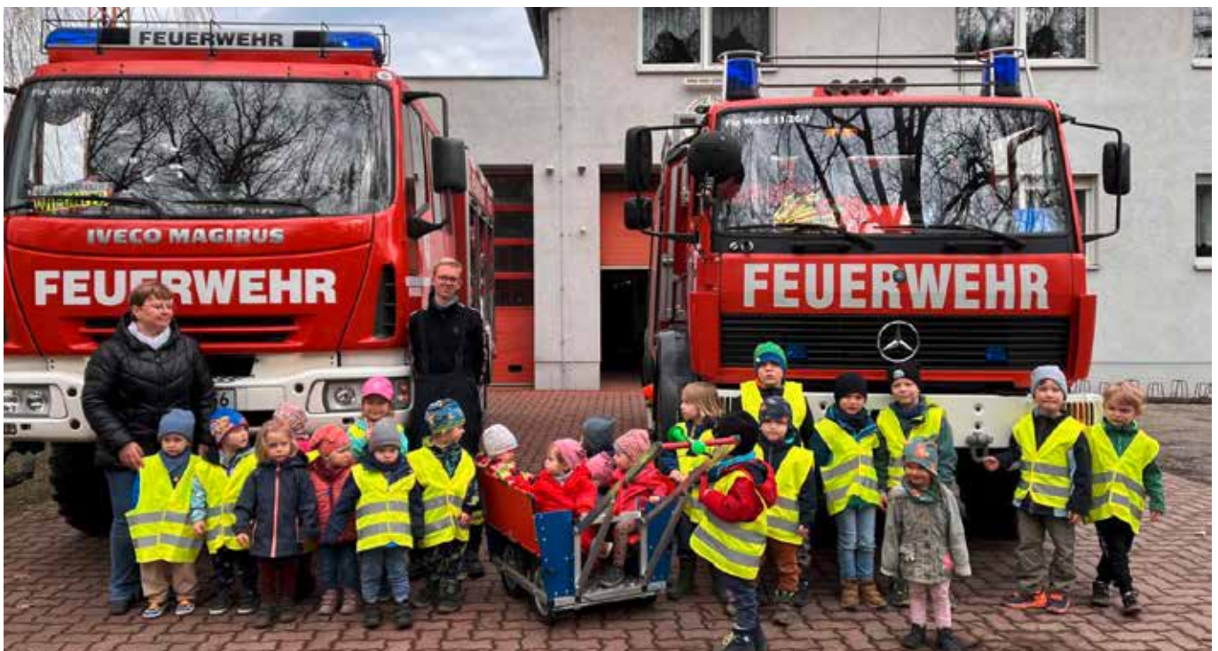
Kita „Fuchs und Elster“ zur Besuch bei der Feuerwehr Wiednitz

Amts- & Mitteilungsblatt der Stadt Bernsdorf mit den Ortsteilen Großgrabe, Straßgräbchen, Wiednitz, Zeißholz 06.05.2023