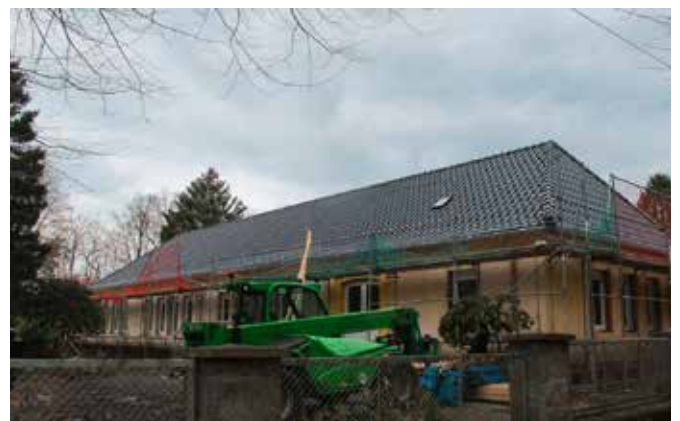
Sanierung Kita Wiednitz