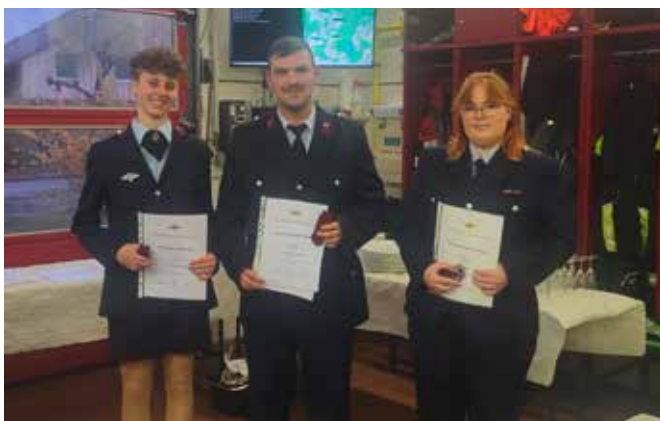
Jahreshauptversammlung Feuerwehr Bernsdorf