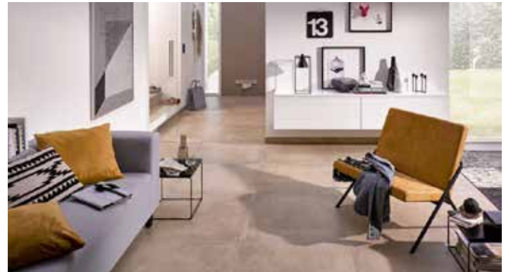
Moderne Bodenfliesen im Cotto-Zement-Look schaffen ein wohnliches Ambiente und sind wie alle keramischen Fliesen ein idealer Belag auf der Fußbodenheizung.

Fußbodenheizungen benötigen wärmeleitenden Belag für hohe Energieeffizienz