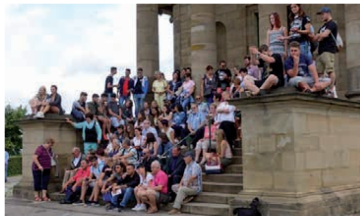
Jugend- und Partnerschaftstreffen in Steinenbronn 2016