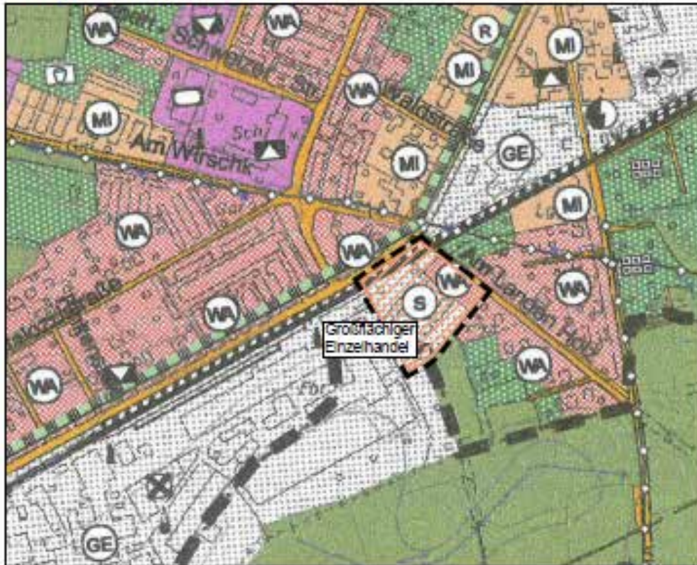
Auszug Flächennutzungsplan 1. Änderung

Der Stadtrat der Stadt Bernsdorf hat in seiner öffentlichen Sitzung am 21.09.2017 den Feststellungsbeschluss zur 1. Änderung des Flächennutzungsplanes der Stadt Bernsdorf in der Fassung vom 04.01.2017 mit redaktionellen Änderungen vom 14.06.2017 gefasst. Die Begründung wurde gebilligt. Die Änderung des Flächennutzungsplanes wurde durch das Landratsamt Bautzen, Bauaufsichtsbehörde, mit Bescheid vom 29.01.2018 – Aktenzeichen 621.39:Bd-01 – genehmigt.