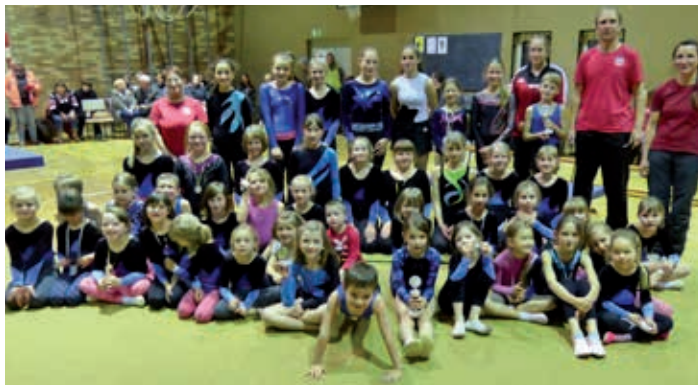
Teilnehmer der Turngala zum 45-jährigen Bestehen der Abteilung Gerätturnen