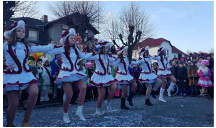
Am 4. Februar fand der 25. Karnevalsumzug in Bernsdorf statt - hier einige Impressionen.