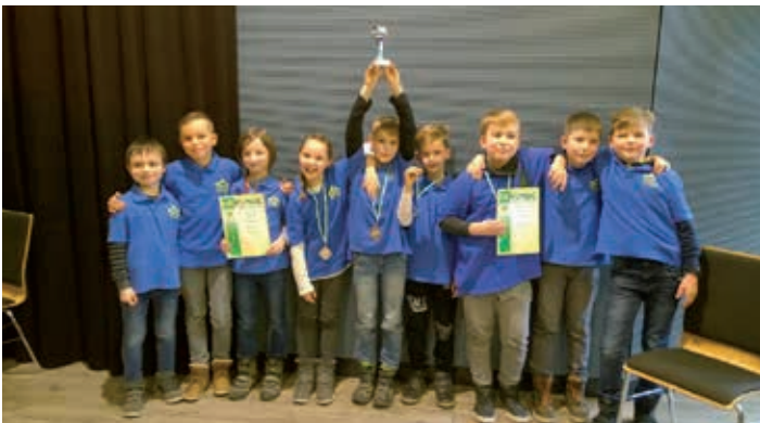
Die AG Schach der GS Bernsdorf feiert den großen Erfolg bei der Schacholympiade in Bautzen