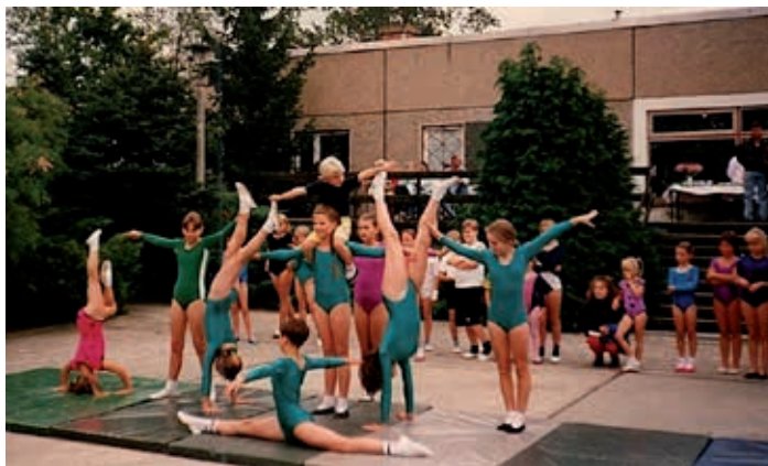
Schauvorführung beim Dorffest 1995