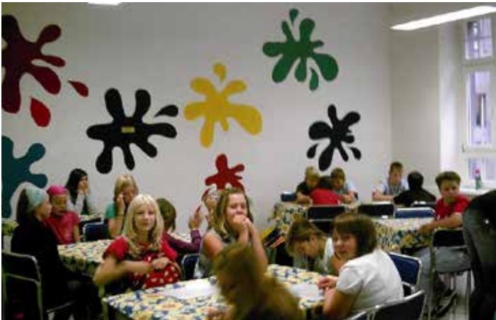
Individuell selbst gestalteter Raum Schuljahr 2010/11