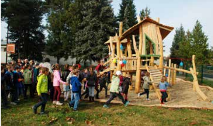
Um eine gute Kinderbetreuung muss man sich als Arbeitnehmer in Bernsdorf keine Sorgen machen.

Straße des 8. Mai 19 / 02994 Bernsdorf / Telefon: 035723 249-60 / info@gmb-bernsdorf.de