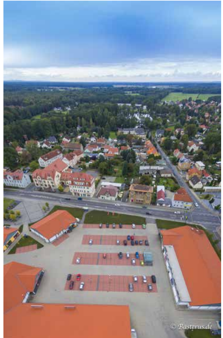
Leben und arbeiten klappt in Bernsdorf wunderbar

Fachkräfte können im Mittelstand angesichts flacher Hierarchien oftmals schnell Verantwortung übernehmen und aktiv gestalten. Hier ist es meist viel einfacher, mit eigenen Ideen und Konzepten durchzukommen und damit