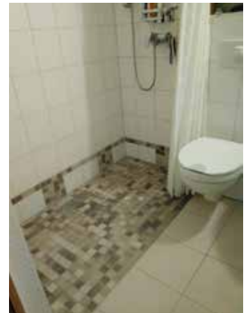
Einige Beispiele für barrierefreien Badumbau aus dem Fliesenhaus Rother in Bernsdorf

Alle Veränderungen des Wohnraumes, die zum Zeitpunkt der Zuschussgewährung erforderlich sind, gelten als eine Maßnahme. So stellt z.B. beim rollstuhlgerechten Umbau der Wohnung nicht jede einzelne Verbreiterung einer Tür eine Maßnahme im Sinne dieser Vorschrift dar, sondern die Türverbreiterungen und die Entfernung von Türschwellen insgesamt. Erst wenn sich die Pflegesituation verändert und weitere Wohnumfeldverbesserungen erforderlich sind, handelt es sich erneut um eine Maßnahme, so dass ein weiterer Zuschuss bis zu 4000,00 Euro bewilligt werden kann.