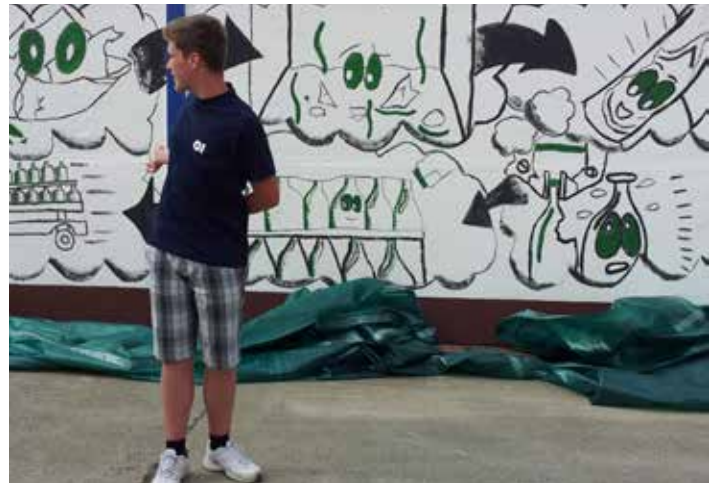
10. Juli 2013 Übergabe Wandbild an OI