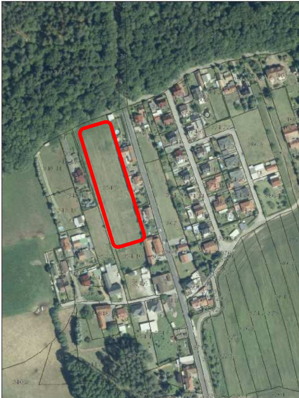
WMS Flurstücke (INSPIRE ANNEX 1) © GeoSN 2019 WMS DOP-RGB © Staatsbetrieb Geobasisinformation und Vermessung Sachsen 2019

Höhenlage: Das Plangebiet liegt bei 145...bis 146m NN. Es ist relativ eben.