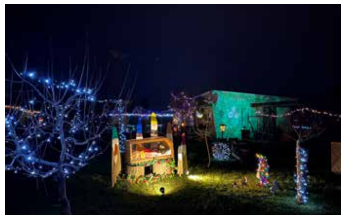
Zauberhafte Gartenweihnacht in Straßgräbchen