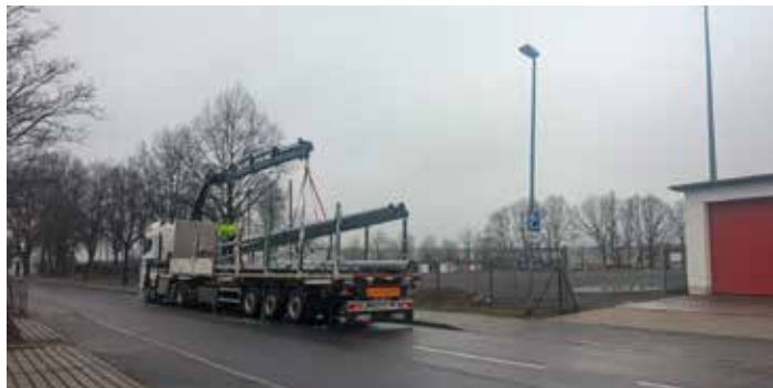
Mitte Januar wurden die Masten für die neue Flutlichtanlage geliefert

In der vorigen Ausgabe konnten wir vom Eingang des Fördermittelbescheides und vom Beginn der Arbeiten an der neuen Flutlichtanlage für den Sportplatz in Straßgräbchen berichten. Die ausführende Firma legte mit Volldampf los. Als am 20. Dezember der offizielle Baustart gefeiert wurde, waren bereits die Kabel gezogen, die Kabelgräben wieder verfüllt und die Fundamente für die Masten gegossen.