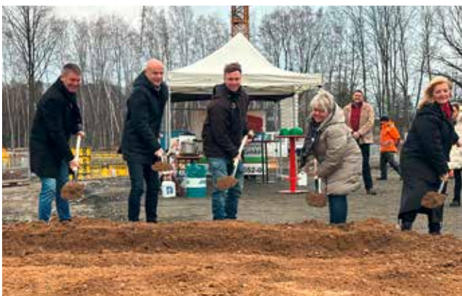
Spatenstich für EDEKA