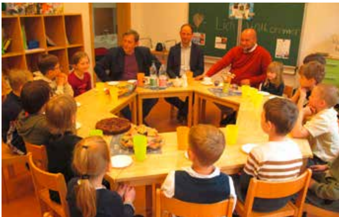
Die Wähler von morgen