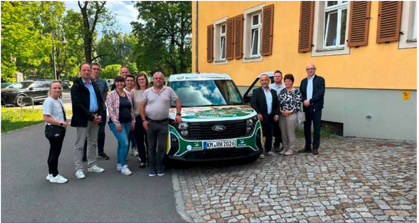
Neues Stadtauto übergeben

Amts- & Mitteilungsblatt der Stadt Bernsdorf mit den Ortsteilen Großgrabe, Straßgräbchen, Wiednitz, Zeißholz 13.06.2026