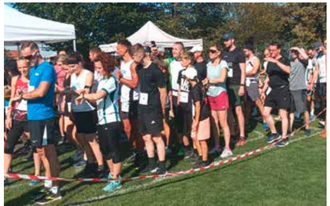
Alle Infos zum 10. Kompressorlauf