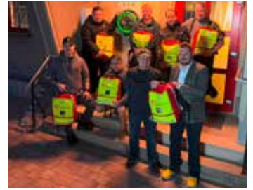
Übergabe der Notfallrucksäcke und des AED (Defibrillator)

Straßgräbchen e.V. brandneue Einsatz- und Notfallrucksäcke an 13 qualifizierte ausgebildete Lebensretter übergeben. Diese Ausrüstung ist ab sofort bei jedem Notfall schnell griffbereit und ermöglicht es den Straßgräbchnern, im Ernstfall noch schneller und besser Erste Hilfe zu leisten. Ein absoluter Meilenstein für unsere Sicherheit!