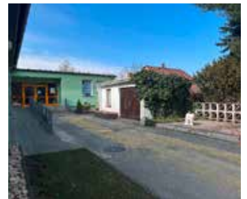
Text: Madlen Schloßhauer