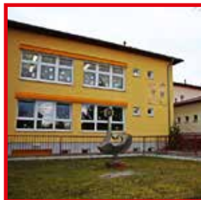
Kita Pfiffikus Albert-Schweitzer-Str. 1a 02994 Bernsdorf