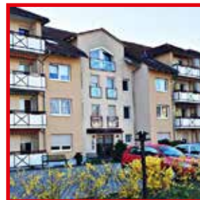
Seniorenwohnanlage Bernsdorf Pestalozzistr. 1 02994 Bernsdorf