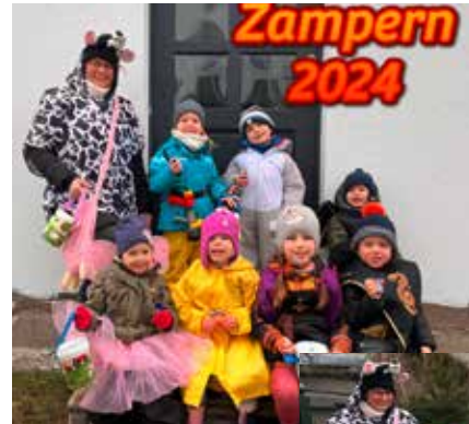
Text / Bilder: Ute Große, Christlich-Soziales Bildungswerk Sachsen e.V.

Die Kinder und Erzieherinnen der CSB-Kita „Fuchs und Elster“ in Wiednitz