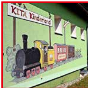
Kita Kinderland Marktstraße 8 02994 Bernsdorf