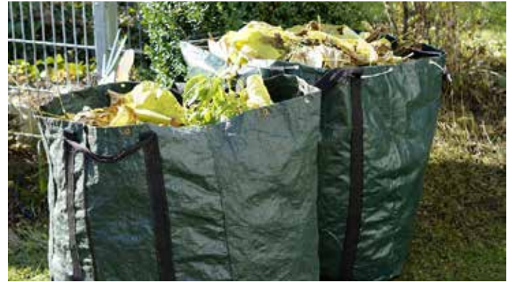
Text: K. von der Linde / S. Linack

Sollten Sie sich unsicher sein oder Fragen haben, können Sie sich direkt auf der Homepage des Landratsamtes Bautzen informieren ( https://www.landkreis-bautzen.de/58-25284.html ) oder rufen Sie uns an (Stadtverwaltung Bernsdorf: 035723-2380).