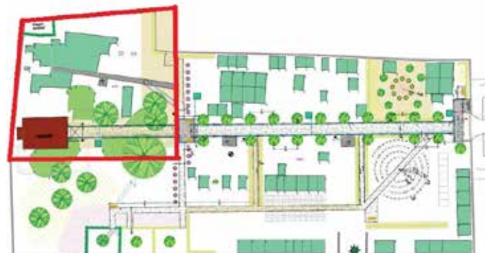
Lageplan: Büro für Landschaftsarchitektur und Freiraumplanung Dipl. Ing. Christine Tenne Der rot umrandete Bereich kennzeichnet das Flurstück, welches durch die Stadt Bernsdorf erworben wird.

Betreutes Wohnen • Hilfe im Alltag • medizinische Leistungen