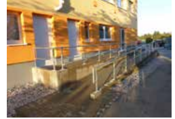
Barrierefrei in die Sporthalle mit Rollator, Krankenfahrstuhl oder einfach nur bequem laufen

Nutzern hätte sich der Verein allerdings das Lob auch gern erspart. Ohne weiter darauf einzugehen: Liebe Radfahrer! Es handelt sich bei der Rampe um eine Erleichterung für Rollstuhlfahrer, Gehbehinderte mit Rollatoren bzw. Mitmenschen