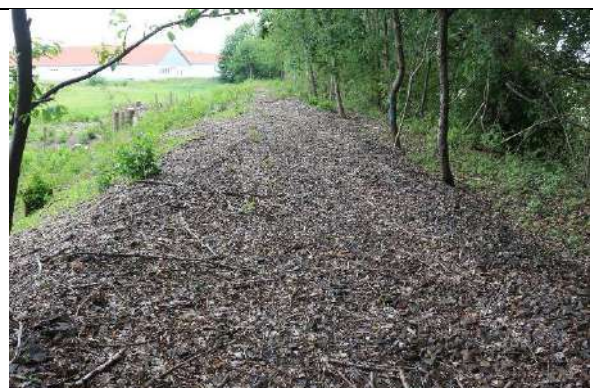
Foto 4: Die nunmehr durch Rodung offene alte Zeiðholzbahn-Gleistrasse (Blick nordwärts) ist mit ihren Schotterflächen zumindest ein potentielles Reproduktionshabitat für Zauneidechsen.