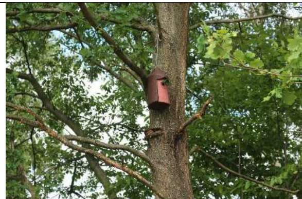
Foto 7: Nisthilfe am verbliebenen Waldstreifen östlich der Zeißholzbahn.