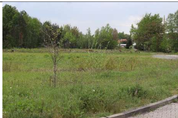
Foto 2: Blick südwärts auf die Offenfläche, die besonders von Rauschschwalben hochfrequent als Jagdgebiet genutzt wird.