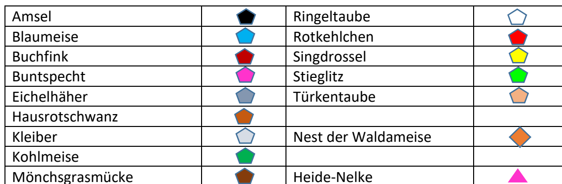
Karte 1: Brutvogelarten, geschützte Pflanzenarten, Waldameisen – Erfassungsjahr 2023