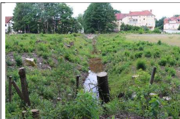
Foto 3: Blick westwärts auf den Saxoniagraben. Hier ist ein Gewässerrandstreifen von mindestens 5 m beiderseits „einzuhalten“.