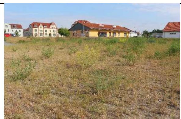
Foto 6: Ansaaten auf kiesigem Substrat mit Recycling-Anteilen dominieren nördlich des Saxoniagrabens.