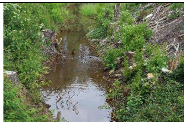
Foto 9: Der Saxoniagraben (Blick ostwärts) dient als Nahrungsgebiet von Wasservögeln (hier ein Stockentenpaar).