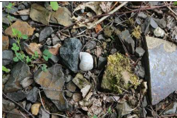
Foto 8: Weinbergschnecken lassen sich vereinzelt im gesamten Untersuchungsgebiet finden.