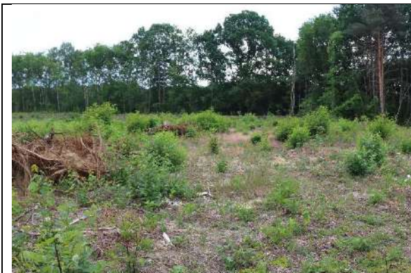
Foto 1: Blick von der Vorhabengrenze südwärts auf den Westteil der Vorhabenfläche.