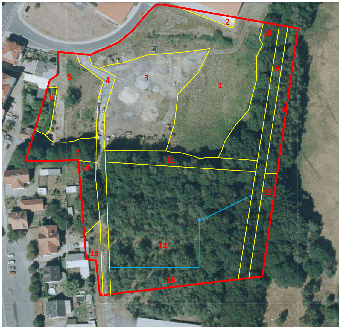
Abb. 3: Räumliche Anordnung der Biotoptypen im Plangebiet.