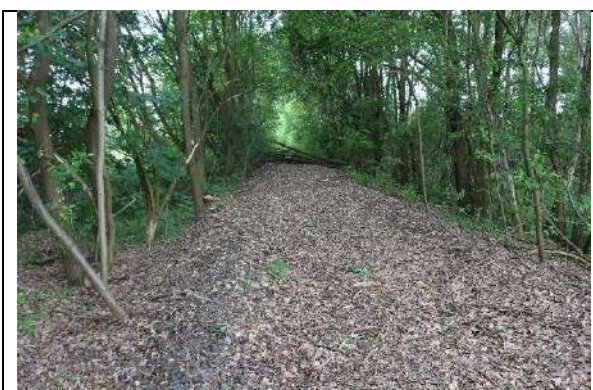
Foto 5: Blick südwärts entlang der alten Gleistrasse der Zeiðholzbahn. Rechts im Bild verbliebener Vorwald.