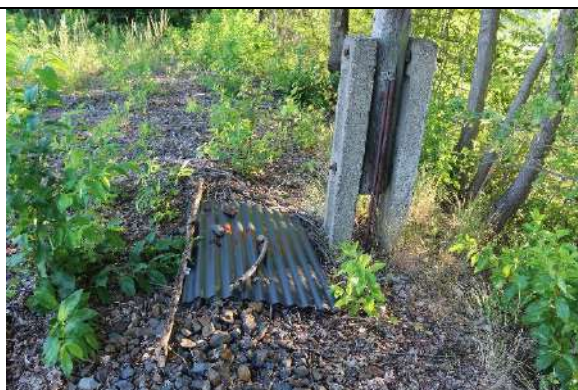
Foto 10: Ausgelegte Reptilien"matten" im Verlauf der alten Zeißholzbahnstrecke (Blick nordwärts).