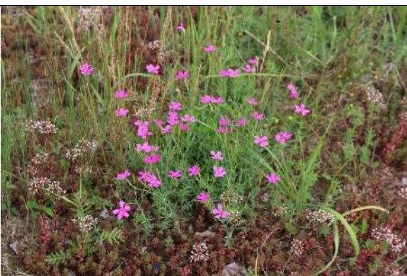
Foto 12: Punktuelle Vorkommen der Heide-Nelke ( Dianthus deltooides ).