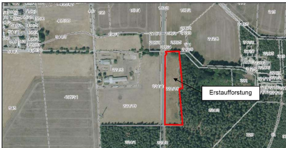
Abb. 4: Fläche für die Anlage eines Stieleichen-Birken-Kiefernwaldes (aus ISP S. 17)